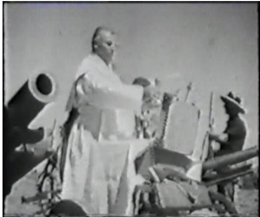
የቫቲካን ቄስ የፋሺሽቱን ጦር ሲባርኩ

በኢትዮጵያ ላይ ለተፈጸመው የጦር ወንጀል፤ በጊዜው በነበሩት ፖፕ ፓየስ 11ኛ ትመረ የነበረው ቫቲካን ከሙሶሊኒና ከፋሺሽቱ አገዛዝ ጋር ተባባሪ የነበረች መሆኑ በታሪክ የተረጋገጠ የማይካድ ሐቅ ነው። ለዚህም ተጨባጭ ከሆነው ብዙ ማስረጃ ውስጥ፤ በቫቲካንና በሙሶሊኒ መሀል የተፈረመው፤ “ላተራን” የተሰኘው ውል፤ ፖፕ ፓየስ 11ኛ የኢጣልያንን ንጉሣዊ መሪ፤ የኢጣልያ ንጉሥና የኢትዮጵያ ንጉሠ ነገሥት በማለት ፖፕ ፓየስ 11ኛ መባረካቸው፤ አጼ ኃይለ ሥላሴ ለፋሺሽቶች የበላይነት እውቅና እንዲሰጡ አንድ ሚሊዮን ስተርሊንግ ፓውንድ ጉቦ ለመስጠት መሞከሩ፤ የቫቲካን ቤተ ክርስቲያን ጳጳሳትና ካሕናት የፋሺሽቱን የኢትዮጵያ ወረራ ለመርዳት ያላቸውን ጌጣ-ጌጥ ማበርከታቸው፤ ወዘተ. ሊጠቀስ ይቻላል። ሌላም ዝርዝር ማስረጃ ስላለ ያንን ማቅረብ ይቻላል።