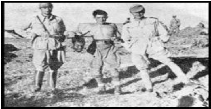
ፋሺሽቶች የኢትዮጵያዊውን ራስ ቆርጠው ሲያሳዩ

በኢትዮጵያ ላይ ለተፈጸመው የጦር ወንጀል፤ በጊዜው በነበሩት ፖፕ ፓየስ 11ኛ ትመረ የነበረው ቫቲካን ከሙሶሊኒና ከፋሺሽቱ አገዛዝ ጋር ተባባሪ የነበረች መሆኑ በታሪክ የተረጋገጠ የማይካድ ሐቅ ነው። ለዚህም ተጨባጭ ከሆነው ብዙ ማስረጃ ውስጥ፤ በቫቲካንና በሙሶሊኒ መሀል የተፈረመው፤ “ላተራን” የተሰኘው ውል፤ ፖፕ ፓየስ 11ኛ የኢጣልያንን ንጉሣዊ መሪ፤ የኢጣልያ ንጉሥና የኢትዮጵያ ንጉሠ ነገሥት በማለት ፖፕ ፓየስ 11ኛ መባረካቸው፤ አጼ ኃይለ ሥላሴ ለፋሺሽቶች የበላይነት እውቅና እንዲሰጡ አንድ ሚሊዮን ስተርሊንግ ፓውንድ ጉቦ ለመስጠት መሞከሩ፤ የቫቲካን ቤተ ክርስቲያን ጳጳሳትና ካሕናት የፋሺሽቱን የኢትዮጵያ ወረራ ለመርዳት ያላቸውን ጌጣ-ጌጥ ማበርከታቸው፤ ወዘተ. ሊጠቀስ ይቻላል። ሌላም ዝርዝር ማስረጃ ስላለ ያንን ማቅረብ ይቻላል።