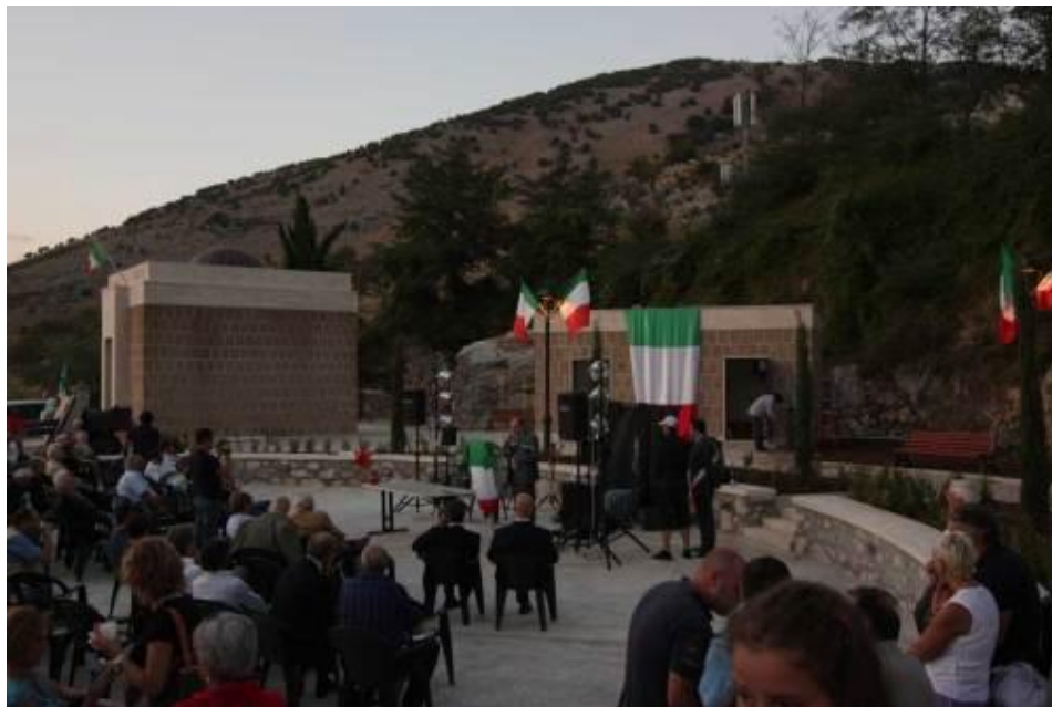
የቫቲካን ተወካይ በተገኙበት ለሮዶልፎ ግራዚያኒ የተቋቋመው መካነ መቃብር ሲመረቅ