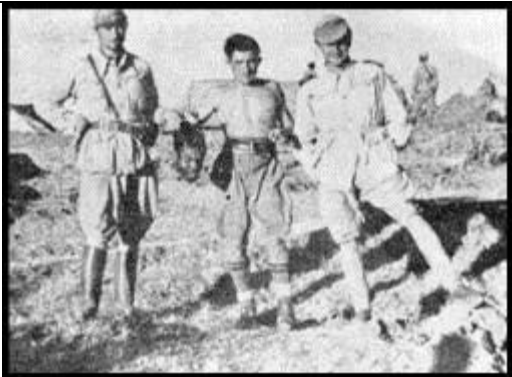
የኢጣልያ ፋሺስቶች ከቆረጡት የኢትዮጵያዊ አርበኛ ራስ ጋር ሲታዩ