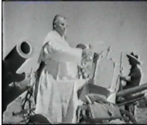
የቫቲካን ካሕን የፋሺሽቱን ጦር ሲባርኩ